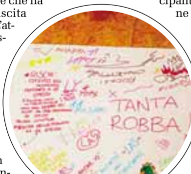
Riflessioni in libertà