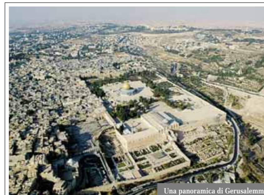
Una panoramica di Gerusalemme